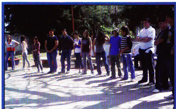
URUGUAY: EL XIV FORO DE CLUBES INTERACT DEL DISTRITO 4980, REALIZADO EN TALA, URUGUAY, CONTÓ CON LA PARTICIPACIÓN DE LOS INTERACT PUNTA DEL ESTE, PAN DE AZÚCAR, MALDONADO ESTE, RÍO BRANCO, Y TALA.