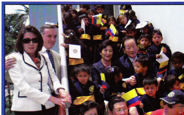
ECUADOR: ROTARIOS DE ECUADOR, DR4400, ACOMPAÑAN AL PRESIDENTE DONG KURN LEE Y SU ESPOSA YOUNG EN SU RECORRIDO POR EL CENTRO DE DESARROLLO COMUNITARIO DE ROTARY QUITO VALLE INTEROCEÁNICO.

EL PASADO 15 DE SEPTIEMBRE DE 2008, el Presidente Dong Kurn Lee realizó una visita a la ciudad de Quito, Ecuador, donde pudo observar algunas de las numerosas obras desarrolladas por los clubes en el Distrito 4400, al tiempo que conoció de